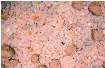
Фото 1. Размер частиц премикса

ПРОЦЕНТ ВВОДА ПРЕМИКСА. На заре появления премиксов на российском рынке существовал ГОСТ только на 1%-ный премикс, в котором в качестве носителя использовали отруби. Позднее из соображений экономической целесообразности начали производить 0,1–0,5%-ные премиксы. И кажется, с экономической точки зрения