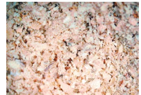
Фото 3. Пористая структура отрубей