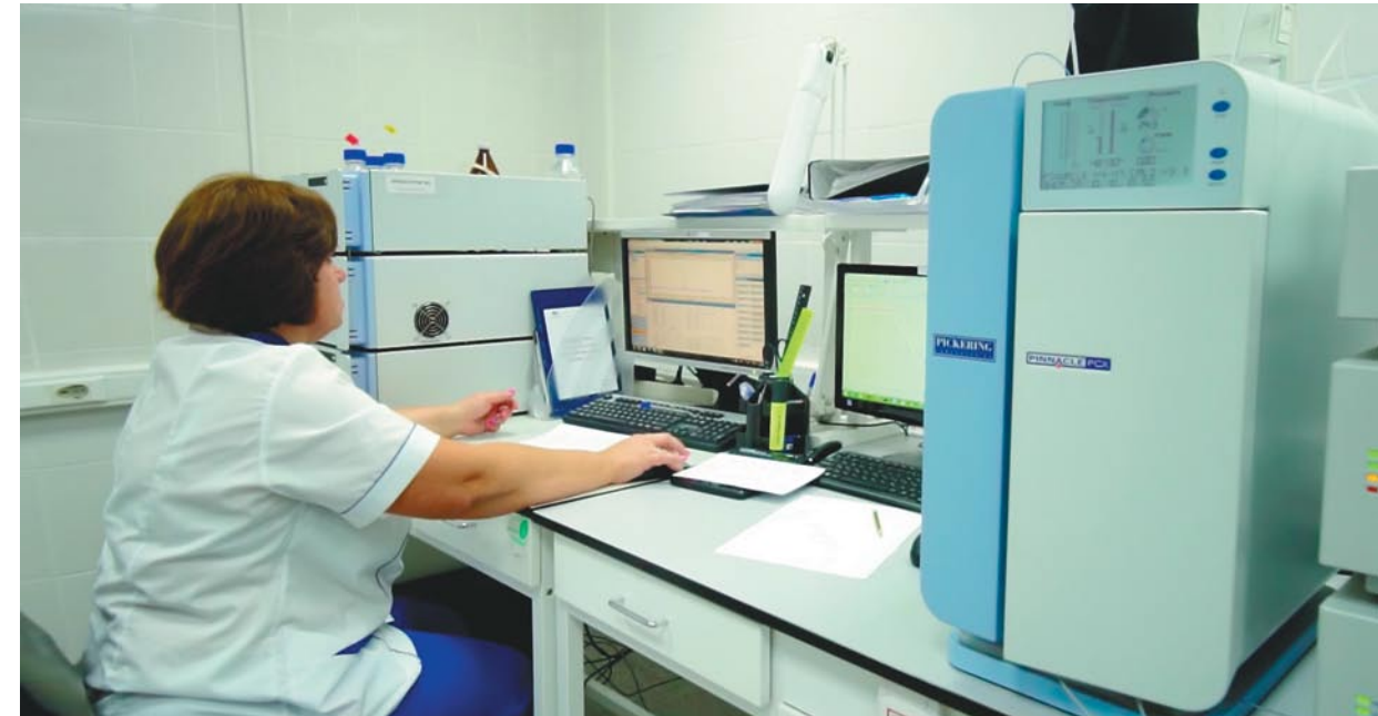
Лаборатория завода компании «Коудайс МКорма» в г. Лакинске