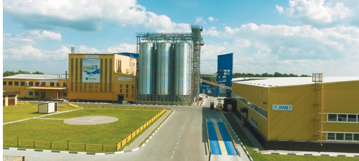
Завод компании «Коудайс МКорма» по производству премиксов в г. Лакинске

SUMMARY. Esobiol® inhibits the action of pathogens in the intestines of birds and stimulates the growth of beneficial lactobacilli. By promoting a symbiotic relationship between nutrition, intestinal microbiota and immunity, Esobiol® can improve the overall health of poultry and help poultry producers to solve such quality, profitability and environmental issues as food safety and reduced productivity.